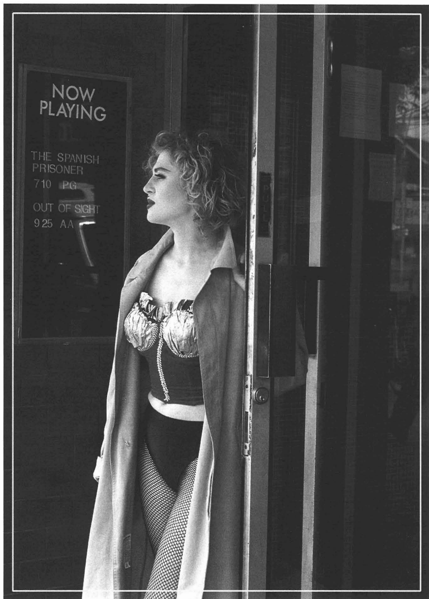
Colour poster, 16.5" x 23.2"